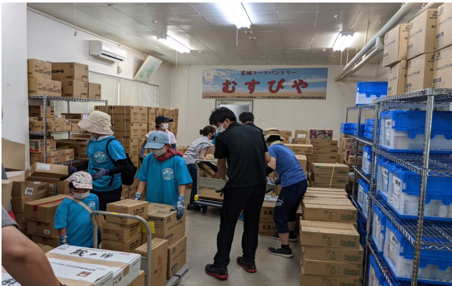
倉庫内 作業の様子