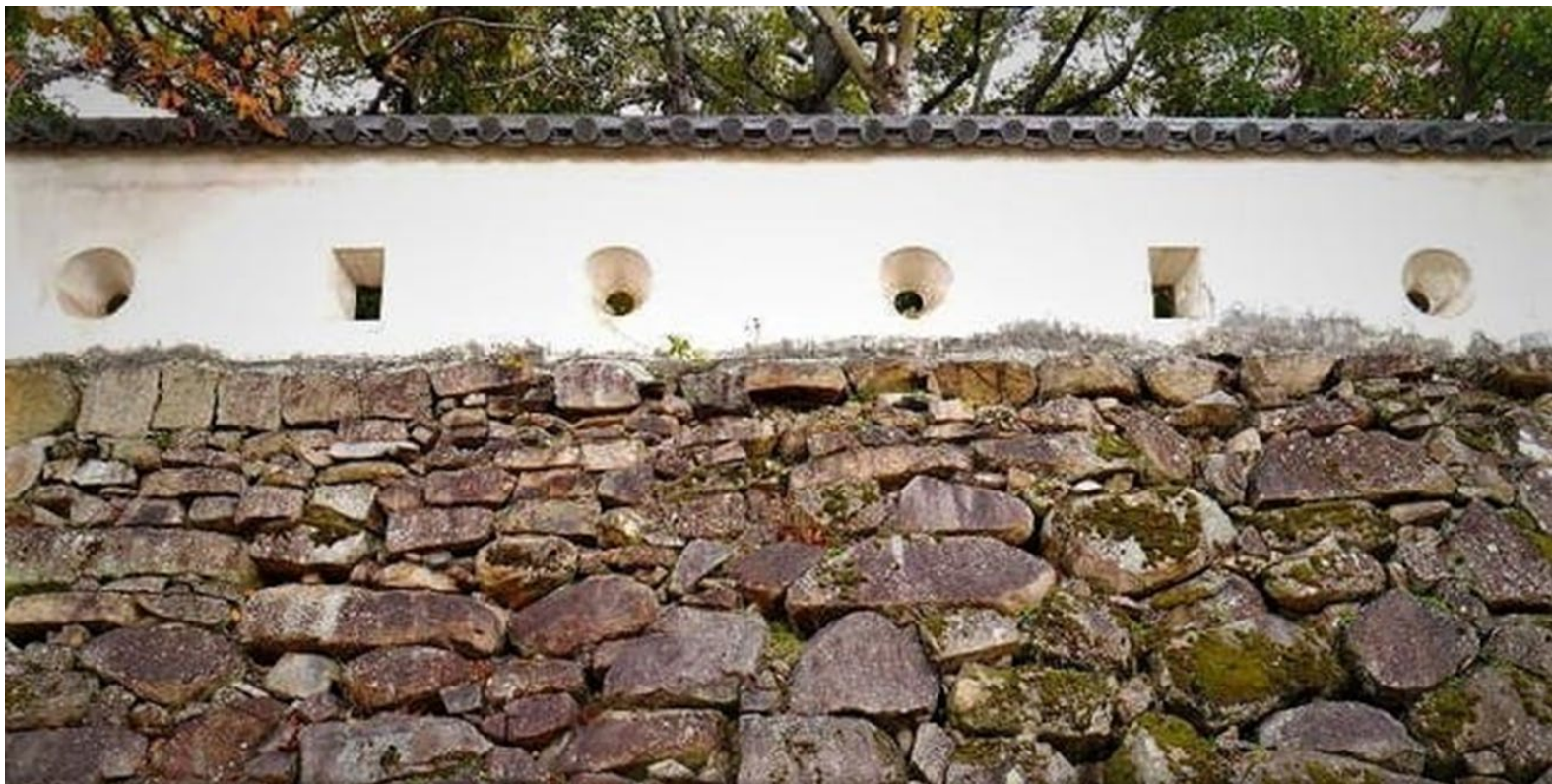
岡山城壁の狭間(さま)