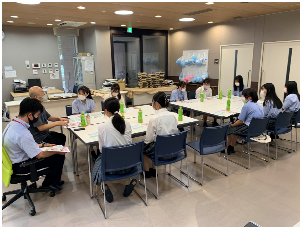
近隣の高校生との話し合い