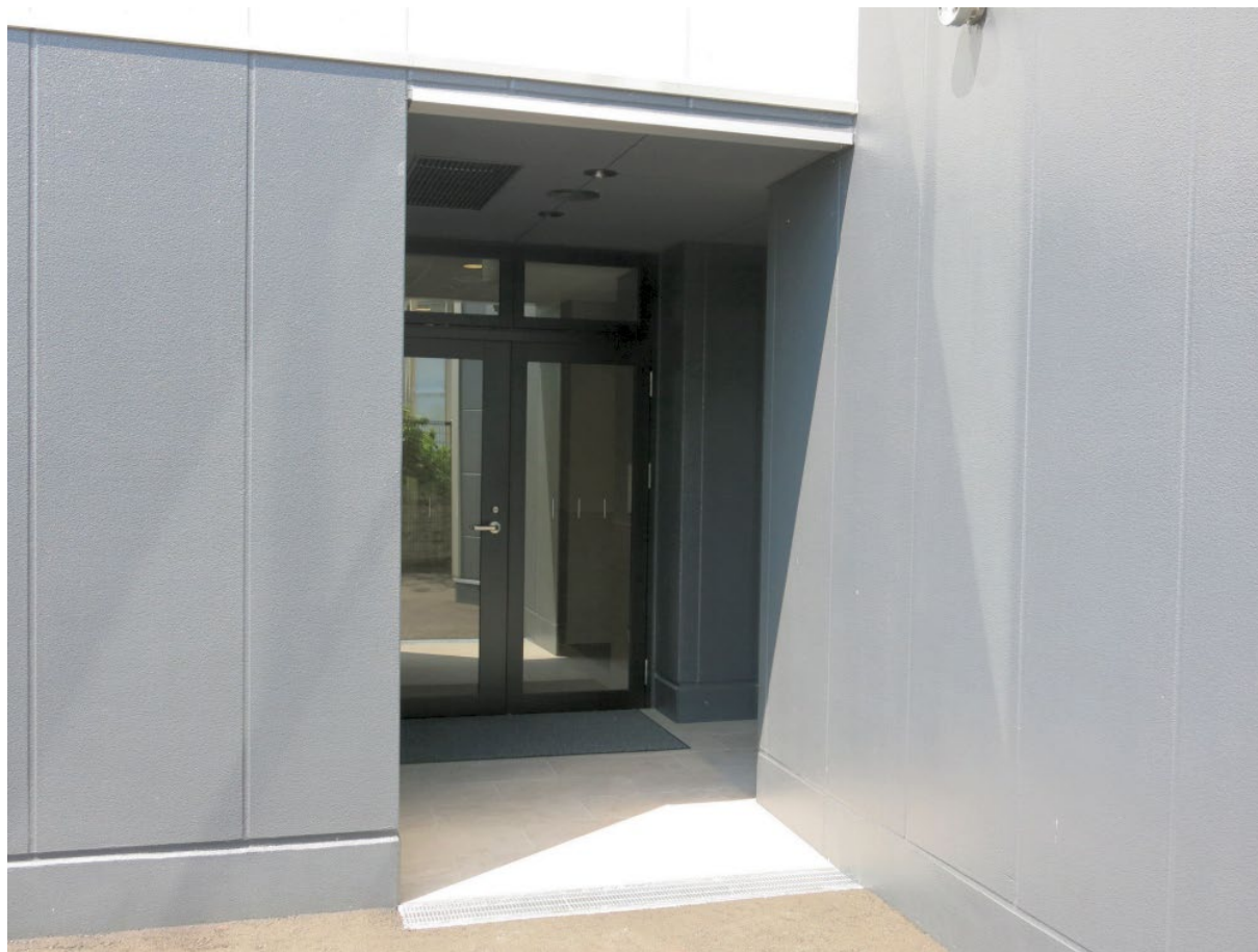
一時生活支援の居室入り口