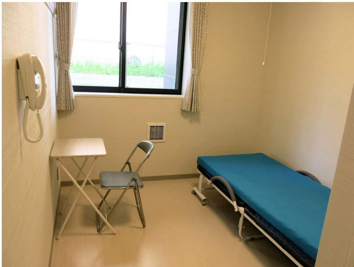
冷蔵庫、テレビ等完備