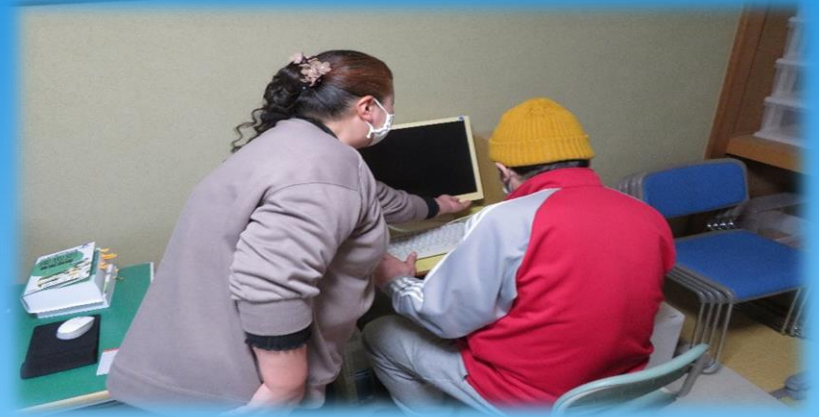
PCの使い方やメールの 使い方の練習