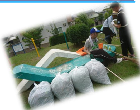
地域ボランティア清掃