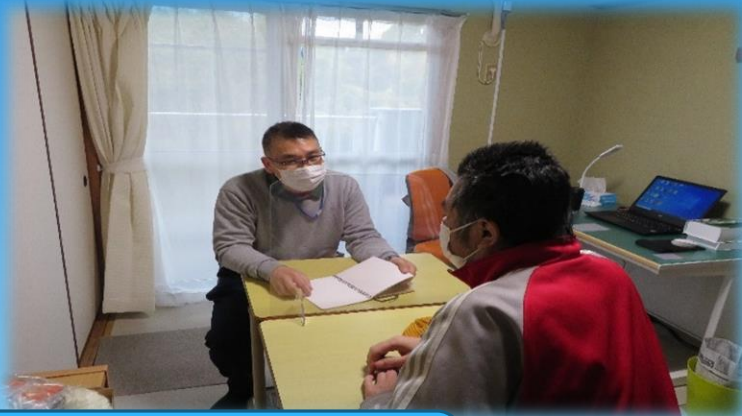
面接の練習や履歴書 履歴書や職務経歴書の添削