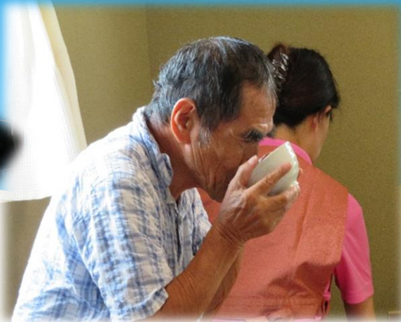
事業所にてお茶会