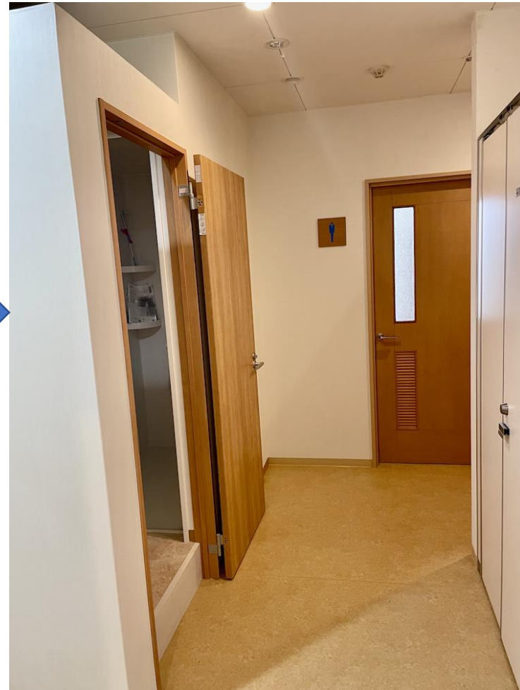
改修後（専用のシャワーブースを設置）